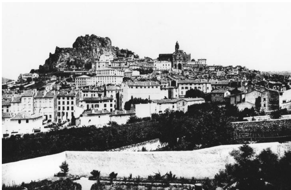
Le Puy, hacia la mitad del siglo XIX.

cha predemocrática y clasista de su tiempo, la cual templó las espadas de la autocracia, tampoco fue condescendiente con aquellos sectores de la izquierda que coquetearon con el centralismo autoritario. Cuando la Comuna de París, para hacer frente al acoso político y militar del gobierno huido a Versalles, decidió por mayoría simple la constitución provisional de un Comité de Salvación Pública, acaparando poderes excepcionales que podían acabar convirtiéndolo de hecho en un órgano dictatorial, Jules Vallès fue uno de los miembros de la minoría opositora que garantizaba que esto no pudiera ocurrir. Siempre estuvo con los humildes y con los peleones, que lo reconocieron como uno de los suyos. En sus artículos, por los que fue perseguido por la policía imperial y que despertaban recelo entre los privilegiados, no hablaba de la miseria y de la opresión abstractas, sino de un joven bachiller deshauciado que lava sus harapos en el río, de una mujer despedida del único trabajo que sabe hacer y que ahora, con el pelo cano, vende su dignidad y sus pechos en las esquinas.